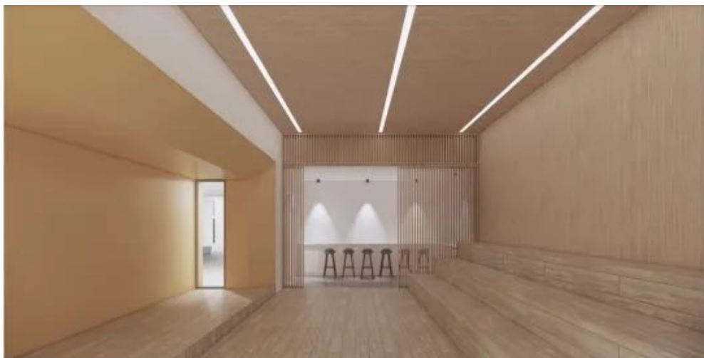
创新教室室内效果

我校将以此次上海市院校创业指导站建站为契机，继续以培养具有创新思维和创业能力的人才为目标，以创新创业指导站为基地，通过校内的创业教育，校外的创业服务，培育学生的创业意识、创新精神、创新创业能力，营造良好的的创业氛围，充分激发学生的创新创业的积极性，书写我校“双创”工作新篇章。