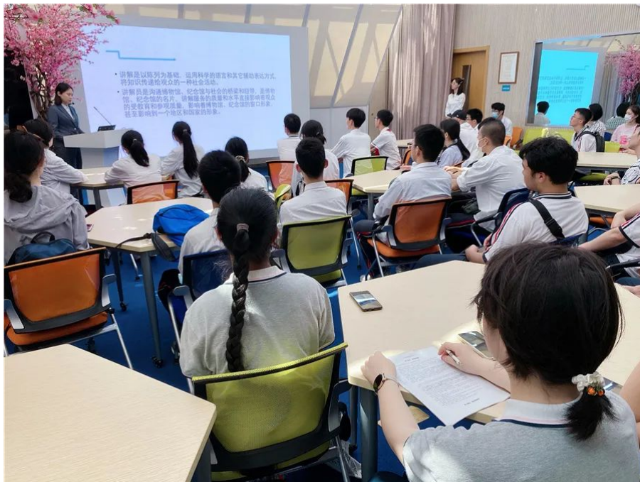
本次志愿服各集中培训，受到了馆方领导的莅临垂询，龙华烈