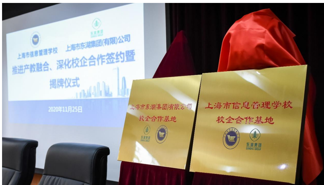
学校与东湖集团推进产教融合、深化校企合作签约

材联合开发、实训设备共享合作，很好地满足了我校航空专业快速发展所需。本年度因疫情原因学校民航运输（空港地面服务）专业服务进博会的工学交替工作暂停，今后将会根据常态化疫情防控形势，继续和机场贵服集团一起扎实推进校企合作。