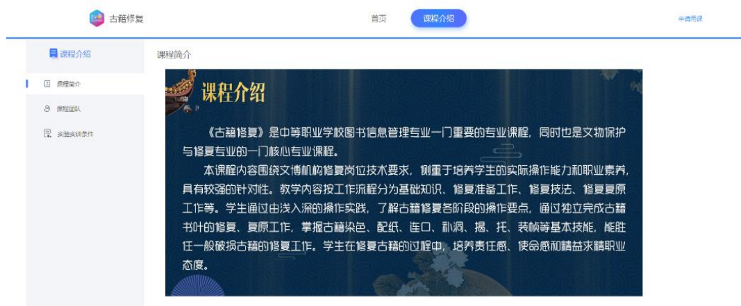
学校开发完成的《古籍修复》在线开放课程

我校图书信息管理专业开设《古籍修复》课程，是文物修复与保护专业的核心课程。今年，学校顺利完成了“古籍修复”在线开放课程建设，通过了市教委教研室验收，获得了“优秀”等地评价。课程共108课时。课程目标是使学生初步掌握古籍图书修复岗位的基本知识和基本技能，具备从事图书馆古籍修复相关工作的基本职业能力。在线开放课程的顺利验收是学校文化艺术专业群内涵建设的又一项突出成绩。