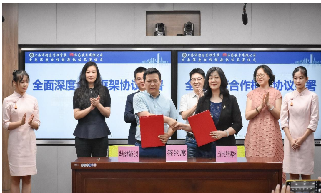
学校与华为技术有限公司全面深度合作框架协议签署仪式

已经被教学实践证明对于提升学生技能有着不可替代的作用。计算机网络技术专业以学校作为世界技能大赛网络系统管理上海集训基地为契机，深入开展与公安三所上海海盾网络技术培训中心合作。本学年，学校继续深化同华为、腾讯等头部企业的合作。本学年，学校与华为技术有限公司全面深度合作框架协议签署仪式在我校蒲汇塘校区隆重举行。该协议的签署标志着学校校企合作和产教融合工作又迈出了扎实的一步，也预示着学校信息产业学院建设的全面启动。同时以学校南部新校建设为契机，开展智慧校园建设工作正在有条不紊地推进之中，争取将新校建设成为屹立在徐汇南部的一所现代化、信息化的智慧校园。